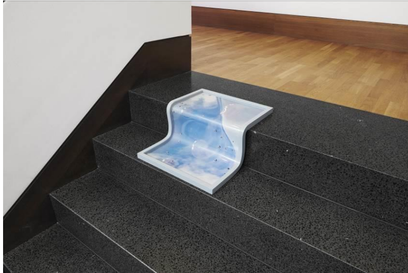
Alex Grein: Cloud , 2021, Ausstellungsansicht: Galerie Gisela Clement

Fotografische Bilder sind Begleiter unseres Alltags. Ob in den sozialen Medien, der Werbung oder der Kunst – Fotografien können Ereignisse dokumentieren, die Wahrheit verfälschen, neue Welten erschaffen. Alex Grein (*1983), Gewinnerin des Landsberg-Preises 2022, geht der Frage nach, wie Bilder im digitalen Zeitalter überdauern können. Dabei untersucht die in Düsseldorf lebende Künstlerin verschiedene Bildkategorien und stellt eine Verbindung vom Virtuellen zum Materiellen her.