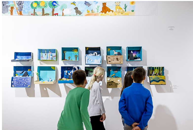
Die KLEINE 2022

Die KLEINE ist die Abschlussausstellung des Kunstwettbewerbs für Düsseldorfer Grundschulen, der zum vierten Mal vom Kunstpalast ausgeschrieben wird. Von Januar bis April 2023 wird von jeder teilnehmenden Klasse ein gemeinsames Kunstwerk zu dem Thema „Von A-Z und 1-10: Die bunte Welt der Buchstaben und Zahlen“ gestaltet. Die anschließende Präsentation im NRW-Forum vereint alle eingereichten Gemeinschaftsarbeiten. Die Besuchenden können für ihr Lieblingswerk abstimmen. Die Klasse, deren Kunstwerk die meisten Stimmen erhält, gewinnt den Publikumspreis. Zusätzlich wird von einer Jury des Kunstpalasts der „Kunstpreis Die KLEINE“ vergeben.