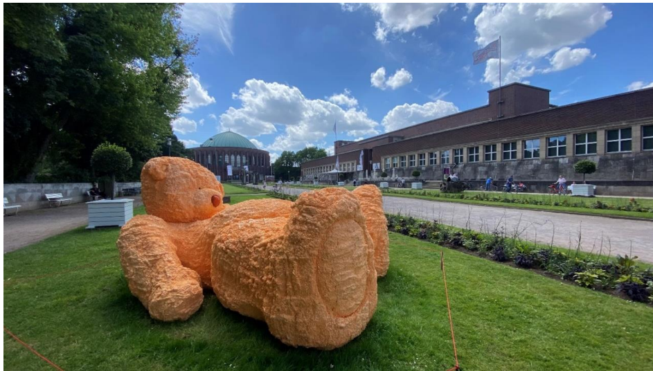
Installation im Ehrenhof während DIE GROSSE 2022

Im Kunstpalast, im NRW-Forum sowie im Ehrenhof findet wieder die größte von Künstler*innen für Künstler*innen organisierte Ausstellung in Deutschland statt. Skulpturen bilden eine visuelle Verknüpfung, eine Art verbindende Blickachse zwischen den beiden bekannten Düsseldorfer Kunstinstitutionen.