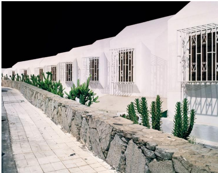
Andreas Gefeller: Soma, 002, 2000