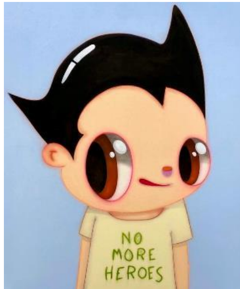
Javier Calleja: No more heroes, 2020

© Javier Calleja, Courtesy Collection Selim Varol