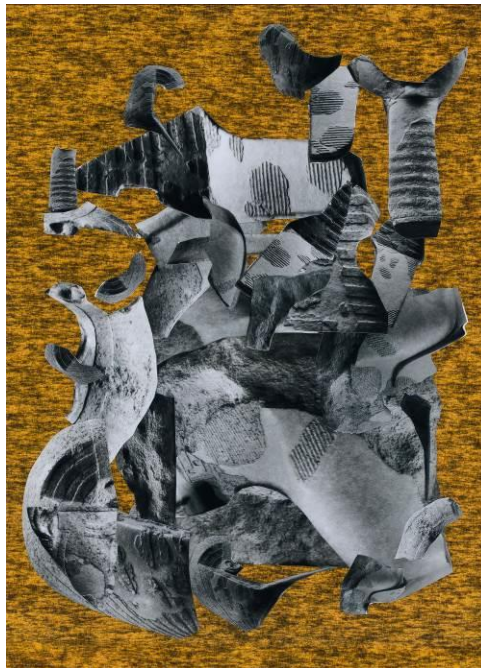
Donja Nasseri, Woman_1, 2020 © Donja Nasseri

Made in Düsseldorf ist eine Ausstellungsreihe der Stadtparkasse Düsseldorf in Kooperation mit dem NRW-Forum. Sie widmet sich zeitgenössischen Künstler*innen, die durch ihr Studium, ihren Wohnort oder durch künstlerische Inhalte in Verbindung mit Düsseldorf und dem Rheinland stehen. Die fünfte Ausgabe präsentiert Arbeiten von Markus Karstieß, Donja Nasseri und Peter Piller aus der Sammlung der Stadtparkasse Düsseldorf. Raumgreifende Keramikinstallationen stehen fotografischen Bildwelten gegenüber, die sich inhaltlich, konzeptuell und materiell mit Kunstformen vergangener Kulturen befassen und diese auf aktuelle Fragestellungen untersuchen.