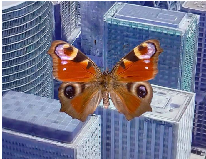
Alex Grein, Aglais io, Frankreich. 2021 (Videostill, Detail), 1-Kanal HD-Video, Courtesy Galerie Gisela Clement, Bonn

Fotografische Bilder sind Begleiter unseres Alltags. Ob in den sozialen Medien, der Werbung oder der Kunst – Fotografien können Ereignisse dokumentieren, die Wahrheit verfälschen, neue Welten erschaffen. Alex Grein (*1983), Gewinnerin des Landsberg-Preises 2022, geht der Frage nach, wie Bilder im digitalen Zeitalter überdauern können. Dabei untersucht die in Düsseldorf lebende Künstlerin verschiedene Bildkategorien und stellt eine Verbindung vom Virtuellen zum Materiellen her.