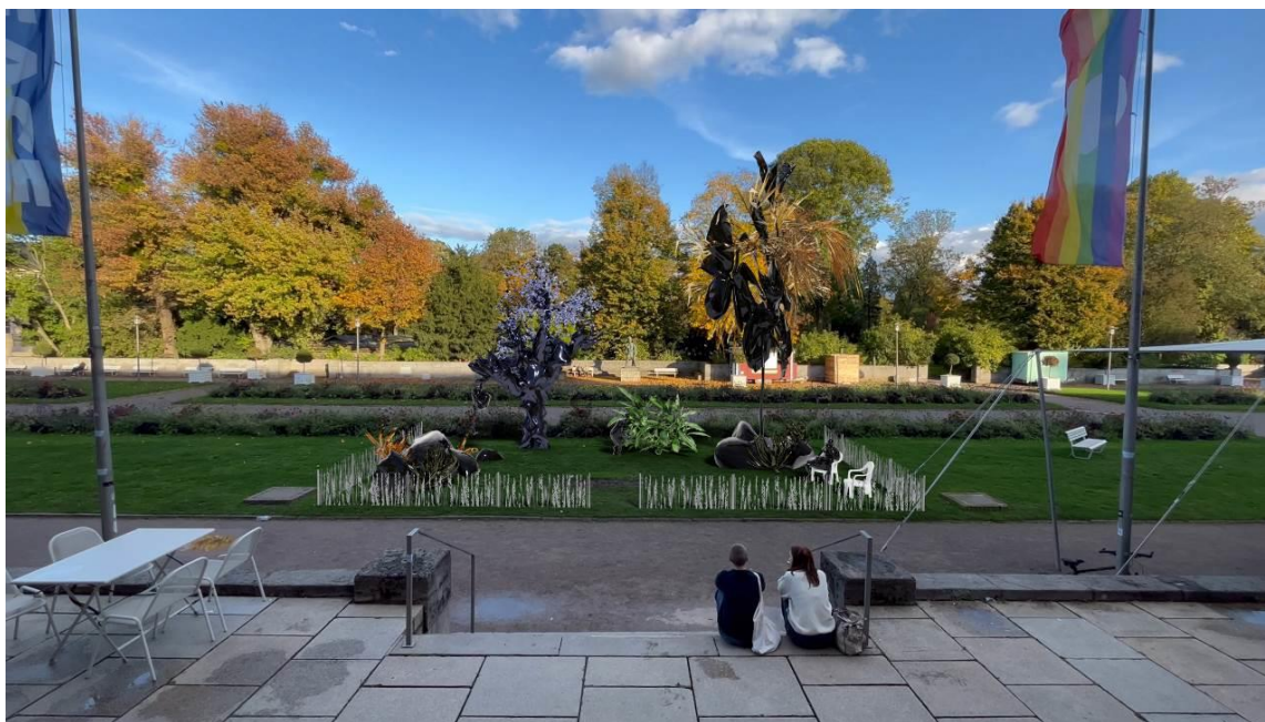
AR Biennale 2023, Felix Giesen: Parzelle 4, 2022 © Felix Giesen