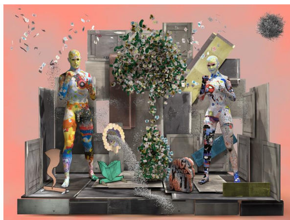
Tumbleweed Moon (Stage I (Auge und Welt)), 2014 © Tim Berresheim

Am Anfang war das Wort, das Feuer und die Kunst. Mit archaischer Kraft inszeniert der Künstler Tim Berresheim eine Evolution des Menschen und der Kunst. Das NRW-Forum präsentiert über 20 Jahre seines künstlerischen Schaffens. Frühwerk und neue, eigens für die Ausstellung konzipierten Arbeiten werden zu einer Ausstellung kombiniert, die mit allen Sinnen erlebbar wird: Besucher*innen tauchen in spektakuläre Bildwelten und außergewöhnliche Mixed-Reality-Installationen ein. Berresheim ist ein Pionier der computerbasierten Kunst. Seine Arbeiten verbindet ein Zusammenspiel aus Kunstgeschichte, Technologie, Wissenschaft und Natur.